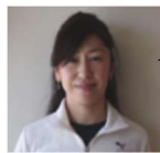
ヨガ 講師 しゅうご先生 火曜日 10:30～11:30