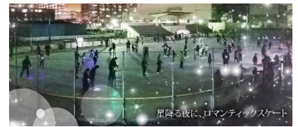
星降る夜に、ロマンティックスケート